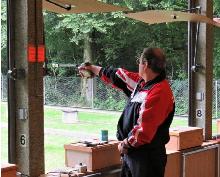
Spürbare Konzentrationsfähigkeit in Kombination mit mentaler Stärke