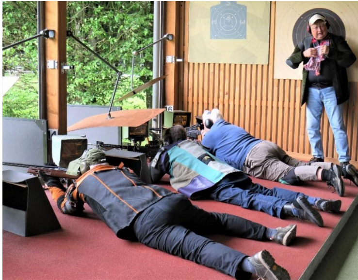
Unterschiedlicher Umgang mit anspruchsvollen Lichtverhältnissen