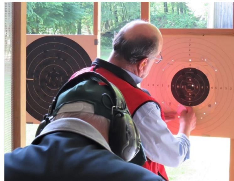
Sorgfältiges Vermessen des Trefferbildes im Solothurner-Stich