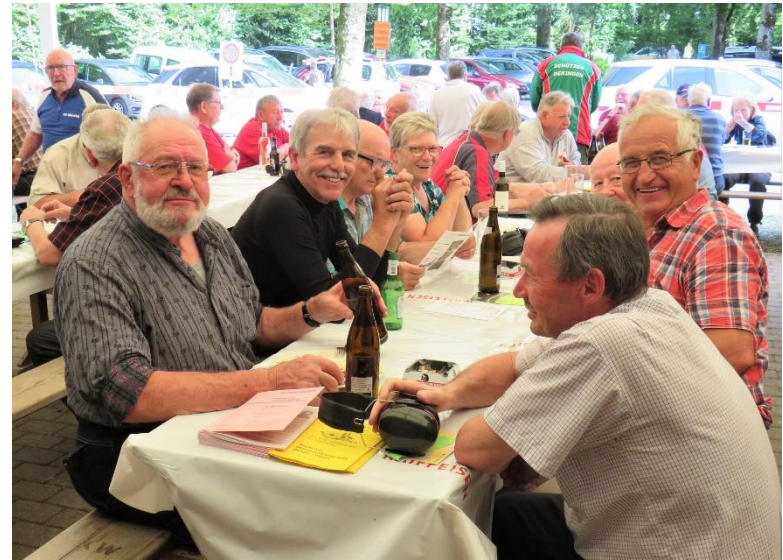
Gelöste Stimmung im gedeckten Vorbau der Schiessanlage "Waldegg"