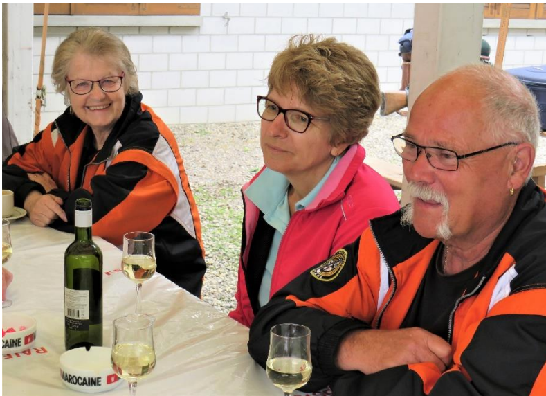
Sichtbare Zufriedenheit nach erfolgreichem Abschluss des Wettkampfs