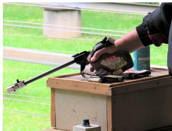
Dieses beeindruckende Sportgerät hätte wohl viele Erfolgsgeschichten zu erzählen ...