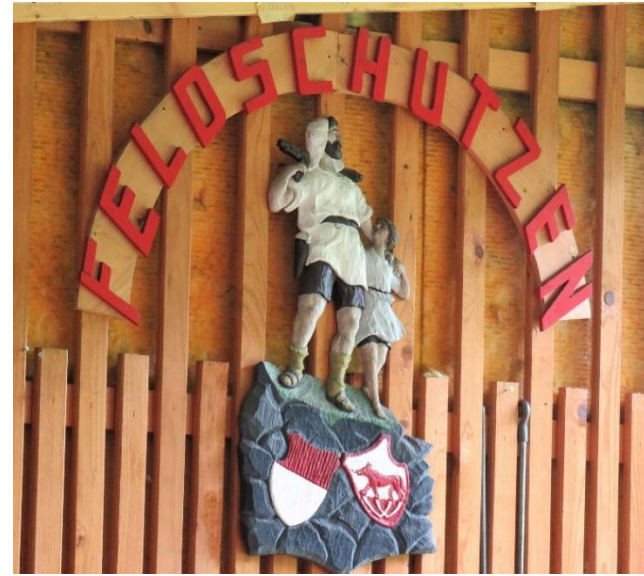
Erinnerungsstück mit kräftigem Symbolcharakter