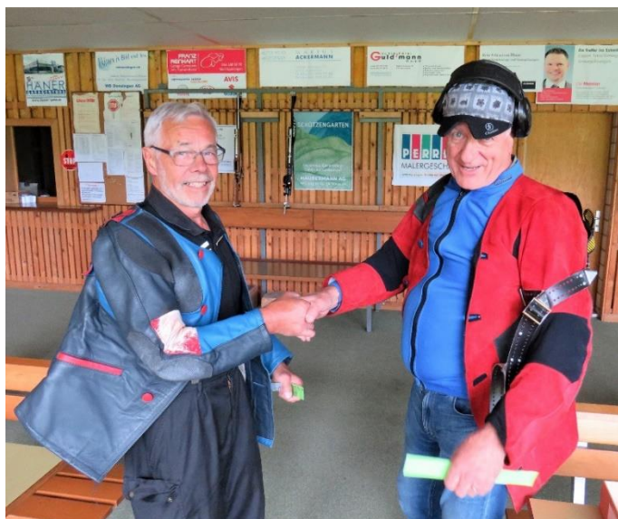
Verdiente Gratulation zu herausragenden Resultaten in beiden Stichen